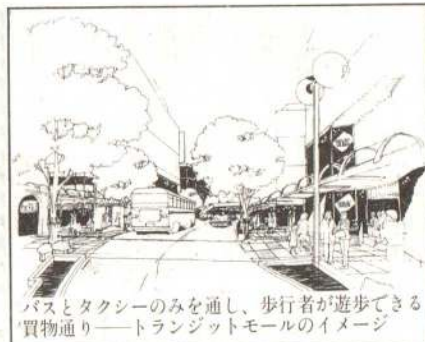
バスとタクシーのみを通し、歩行者が遊歩できる買物通り——トランジットモールのイメージ

駅前通りは、自動車交通を制限して、バスとタクシーのみを通し、歩行者がぶらぶらしながら買物のできる通り(トランジットモール)としています。商店街は店づくり協定をし、特色のある専門店街をつくるとしています。