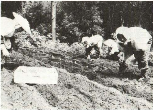
▲畑作活動 (釈迦内老人クラブ)

6月13日、老人いこいの家の菜園10アールに、釈迦内老人クラブの会員約50人が大豆の植え付け作業を行いました。参加者は、堆肥を敷き、手慣れたクワさばきでうねを作った後、1本1本でいねいに苗を植えました。毎年この畑で収穫した大豆は、市内の幼稚園などに届けられたいへん喜ばれています。