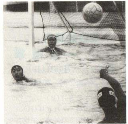
▲秋田県代表は能代工業高校