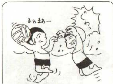
△ボールを持っている選手にはアタックしてもよい。

選手がそれぞれ自軍のゴールライン上に並び、審判が笛の合図と同時に競技場中央にボールを投げ入れて試合が開始されます。ドリブル(顔の前にボールを置き、クロールで泳ぎながらボールを運ぶ)や片手でパスをしながら相手ゴールに投げ入れます。得点は一点。