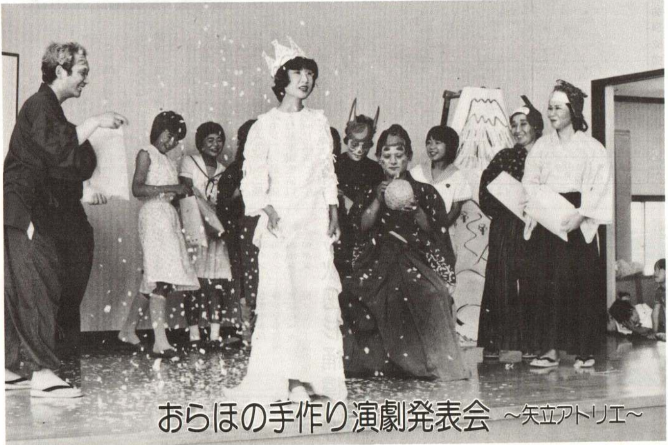
おらほの手作り演劇発表会 ~矢立アトリエ~

「わたしたちの手作り演劇を見てください」——「矢立アトリエ」の演劇発表会が、6月24日矢立公民館で開かれ、大勢の観客の前で熱演しました。