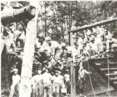
▲アスレチックでひと汗を流す子供たち

▼宿泊棟……宿泊室(二百人)、食堂、浴室、学習室、視聴覚室、レクリエーションホール、事務室など ▼屋外施設……大宮火場、キャンプ場