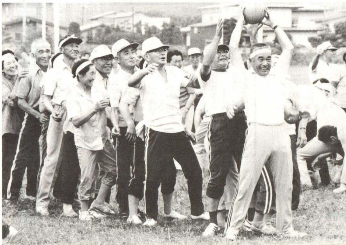
▲山あり谷あり……恒例の「ボールの旅」