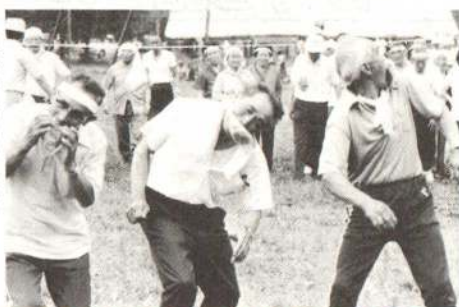
▶大きな口をあけて……パン食い競争