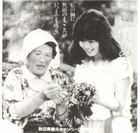
秋田県観光キャンペーン 9/1～12/31