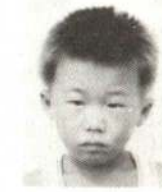
◀ささじましゆん (5歳)