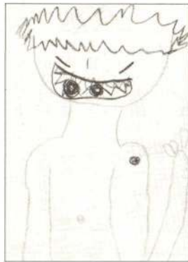
「鬼のスプーン」より なみおかなほこ (5歳)