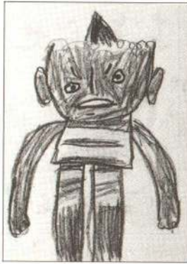
「鬼のスプーン」より かわたしんいち (5歳)