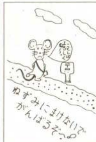
59年1月号の作品から

あなたの手作り年賀状を、市民の皆さんにお届けしませんか。広報では、皆さんのユニークで楽しい手作り年賀状を募集しています。イラストや漫画をいれたもの、将来への大きな夢、抱負など何でも結構です。奮ってご応募ください。採用された方には記念品を差し上げます。