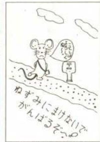
59年1月号の作品から

あなたの手作り年賀状を、市民の皆さんにお届けしませんか。広報では、皆さんのユニークで楽しい手作り年賀状を募集しています。イラストや漫画をいれたもの、将来への大きな夢、抱負など何でも結構です。奮ってご応募ください。採用された方には記念品を差し上げます。