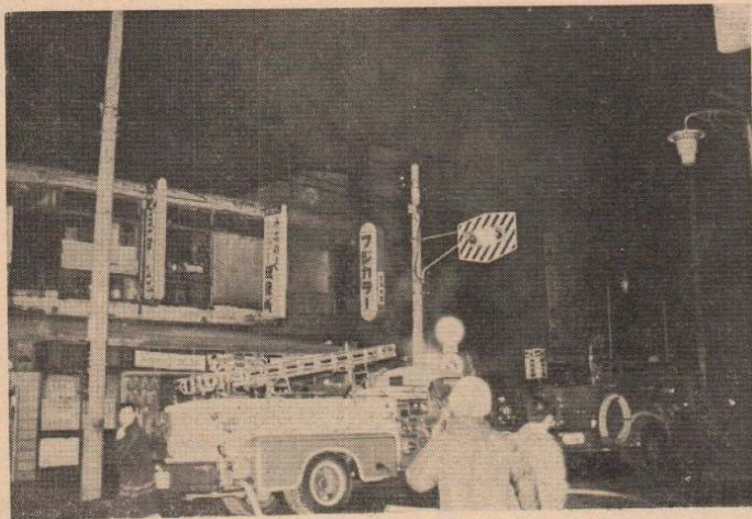
(写真、4月18日の早朝起った市役所前の火事現場)