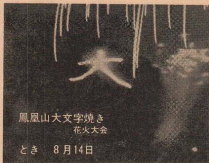
鳳凰山大文字焼き 花火大会

非行少年は、一致して何か孤独感をもっています。すべての人が連帯して、あやまちのあった人たちの更生保護に力を入れ、以前の明るい人間にもどってもらうことを願おうではありませんか。