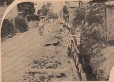
舗装工事はまず側こうの整備から——急ピッチに進む川原町線 8月10日完成の予定です。