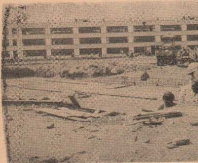
↑6コース、25mプールの建設を急ぐ城西小学校 8月15日、完成予定です。