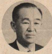
初代大館商工会議所会頭として、18年余の長きにわたり、市の商工業の発展に尽された功績が顕著である。