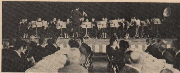
市立第一中学校 プラスバンド による市民歌の演奏風景