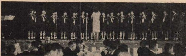
←市立花岡中学校女子生徒による市民歌の美しい合唱は式典をさらに盛り上げてくれた