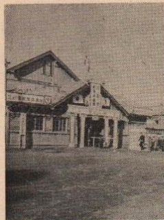
十七年前の大館駅・昭和三十年五月三日 の大火で焼失す