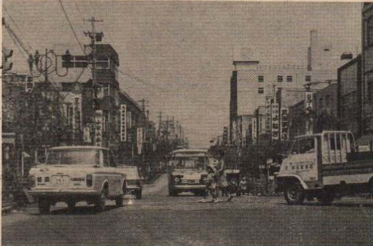
四度の大火に見まわれた市街も、市民の力によって二十年前に比べて街なみも見えるようになった。写真は一月前の大町通り。九月八日には、立派なアーケードも完成一段と生彩をはなっています