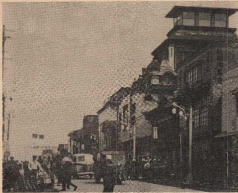
市制施行当時の大町通り。 昭和三十一年八月十八日の大火 によってこの附近一帯が焼失した。 大火前の大町通りを思いださせ る唯一の写真です。