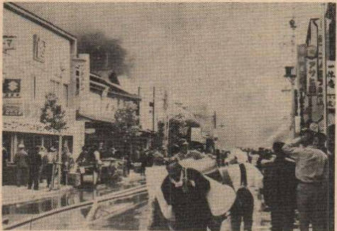
市制施行以来、昭和二十八年、三十年、三十年、そして四十二年と、矢張り早やに襲った大火は、大館の歴史に類のない大火でもあった。大火と復興のくり返しの二〇年、しかし復興に見せた罹災者の底力こそ、新しい大館をつくる原動力になることでしょう。(二丁目の大火)