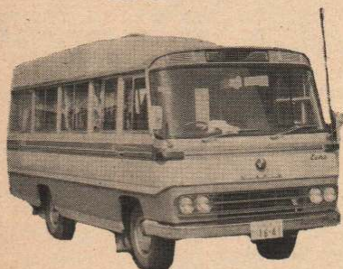
〔写真は移動交番車〕

一方、4月9日、日鉱と釈迦内の地盤沈下被害者交渉委員会の間で、水田買収の協定調印式が行なわれました。これは、日鉱が将来、黒鉱開発によって地盤沈下が予想されるこの地区の水田22ヘクタールを、4億円で買収するための話し合いがつついたため協定を結んだもので企業が事前に配慮したこの誠意は、全国的に話題にのぼっています。