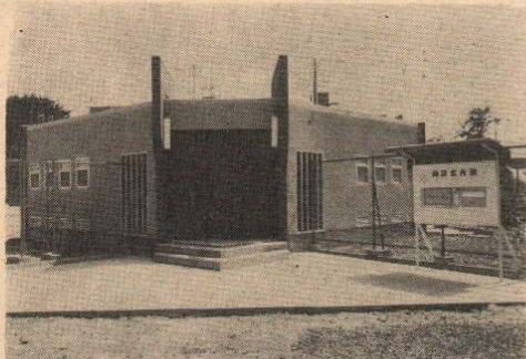
【写真】上は完成した五十メートルプール、左は管理棟