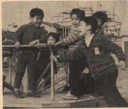
↑年4月1日現在で10才に満たない児童)となり昭和49年4月1日からは、完全実施されることになっています。↑

各地区の敬老会でも、このことが話しされたことと思いますが、75才以上の方でも「支給対象者証」(カード)を持っていないと支給されないことになっています。カードは、福祉事務所に皆さんが加入している、健康保険証や国民健康保険証と印かんをお持ちになれば、すぐ差しあげますので、まだ、カードを持っていない方はお医者さんにかかる前に、もらっておいてください。