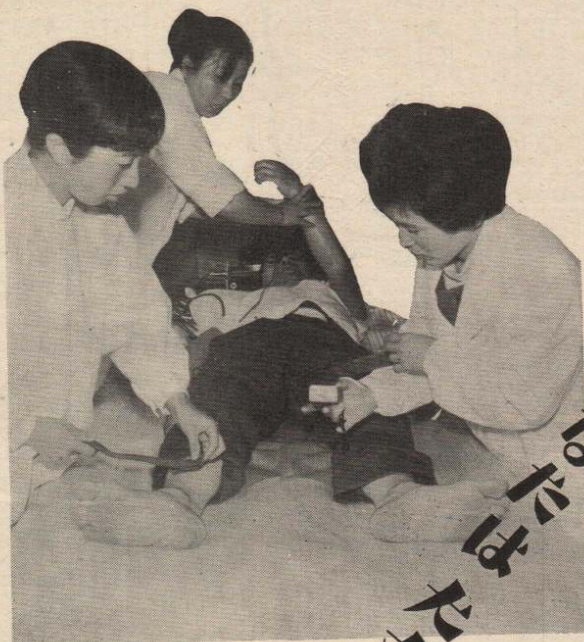
市で購入した「心電図」は住民検診に大きな役割をはたしている。

(注) 日時、会場などくわしいことは、各家庭におくばりしてある検診と予防接種実施計画一覧表をごらんください。