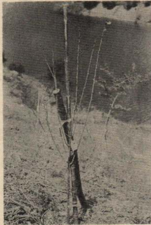
て市民の皆さんが参加してくださるようお願いいたします。

市民の皆さんの手で植えた桜が、鳳凰山の「大文字」とならんで、1日もやく「日本一の桜名所」になるよう、見まもっていきましょう。なお、らい年の植樹には、今回にまし