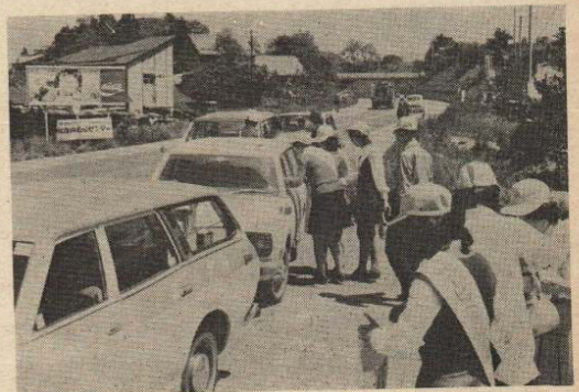
(写真) 交通安全を呼びかけ 冷たいジュースをサービスする社員

なお、いたみの著しい配線については市と東北電力が協力して取り替えることになっています。