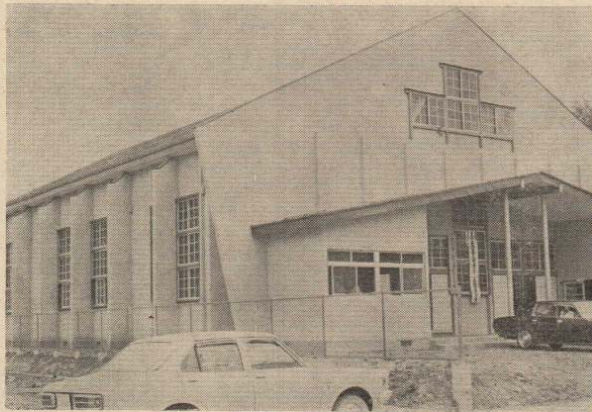
(写真) 完成した有浦スポーツ館

使用は6月17日から許可をしておりますので個人の体づくり、グループのスポーツ会にご利用いただければ幸いです