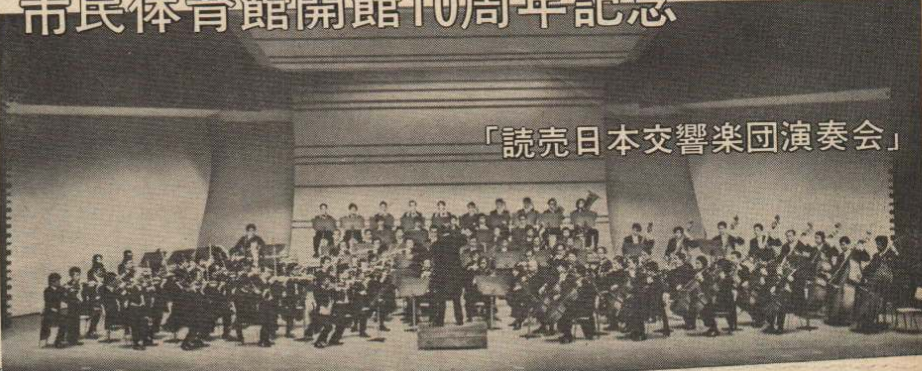
「読売日本交響楽団演奏会」

●とき 10月31日(水) ●開演 18時30分 ●曲目 ベートーベン作曲、交響曲第5番(運命) ほか3曲 ●入場料 A席 1,300円 B席 1,000円 C席 500円 ●前売券発売開始 10月1日 ●前売券発売所 市民体育館 正礼デパート 石川書店 又久書店 市連合婦人会