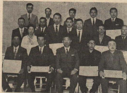
(市長を囲んで記念撮影)