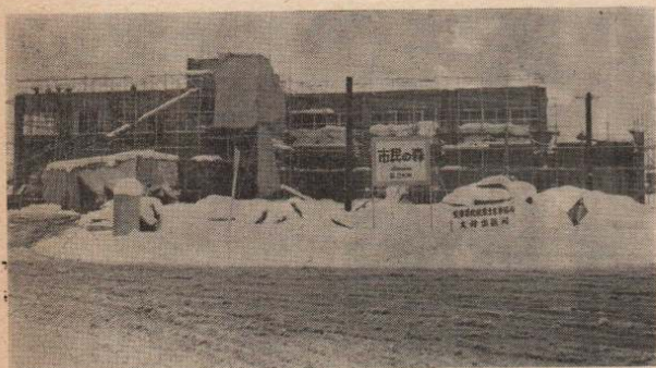
↑建設中の消防本部庁舎