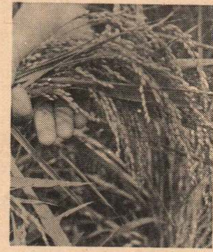
ますますの収穫を得た試験田の稲穂

氏のお話によると、その成果を一応認めながらも「稲が倒れやすく、その防止対策は今のところむずかしい。また、稲刈りにも難点があり、農家にこの方式をすすめるには時期早尚ではないかと思う」といっています。