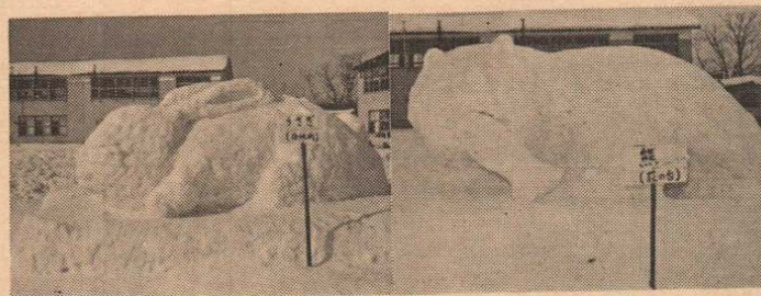
谷地町のうさぎ [佳作] 萩の台の熊