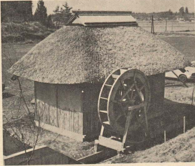
(写真) 駐車場わきに完成した「水車小屋」 小屋の中は休けい室になっています

行楽シーズンがやってきた。雪消えとともに若者たちは待ちかねたように野や山に緑と澄んだ空気を求めてたむろする。そこには、友情と歌とダンスがあり春の到来を私たちにつけてくれる。これは「市民の森」で青春を謳歌する若者たちの一コマであるが、この市民の森に新たな名物「水車小屋」が完成し人気をあつめている。カヤぶきの屋根と直径2mもある水車は、苦心作とあって出来ばえもりっぱなもの、広大な森の片すみにできた水車小屋は、森の情緒を一層豊かなものになっている。 ところで、春のおとずれとともに市民は行楽を求めて野山に、温泉地へと出向う。ここで足をとめて市内の行楽地をふりかえてみよう。温泉地は大滝、雪沢、日景、矢立、沼館、長瀬は他におとらないし、桜もまた、桂城公園、長根山の1万本桜、曲田、大滝と名所が多く、わざわざ遠くに出かける必要もないくらいだ。これらの行楽地には、ごらんの市の保養所もあって、市民の利用を待っている。「デスカパー大館」とでもいおうか、数多い市内の行楽地を改めて見直そうではありませんか。