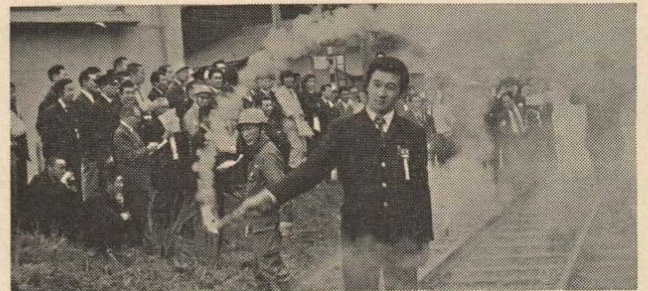
幸町の踏切で行った想定訓練

踏切事故は大きな事故につながりやすいため、とくに、車を運転する方は、必ず一時停止をして、十分安全を確認してから渡るよう心がけていただきたいものです。