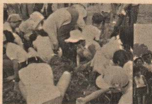
かわいい小さな手で、つぎつぎと、花の苗が植えられてゆく ビューティ作戦