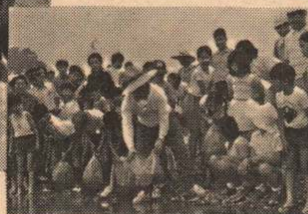
「はやく大きくなあれ!」稚魚を放流する子供たちと石川市長