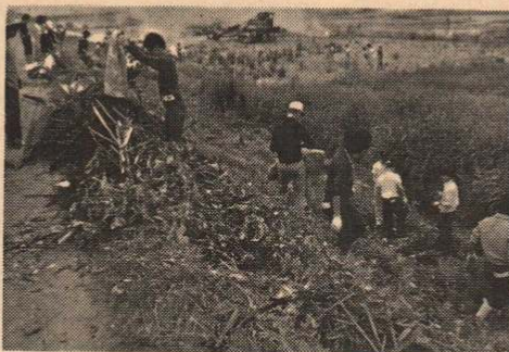
市内を流れる川は市民の心の鏡 みんなの手でクリーンアップ作戦

約2時間半にわたる長木川クリーンアップ作戦は午前11時頃に終了、全員すがすがしい、さわやかな面持で帰路につきました。