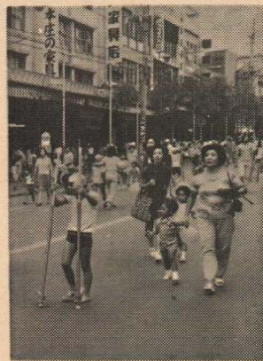
昨年の歩行者天国 (大町中央通り)

今年の夏まつりは、8月6日に行われますが、昨年にひきつづき、歩行者天国も実施され、この時間には、鼓笛隊の行進をはじめ、おそろいのゆかたを着た連合婦人会のご婦人や高校生たち2,000人以上による大文字踊りなど、また、夜は今年はいじめての企画である大文字太鼓の打鳴しや、花火踊りなどを、日本一の大文字焼きと平行して行うなど、多彩な催し物で趣向をこらし、皆さんに十分観賞していただくことにしています。