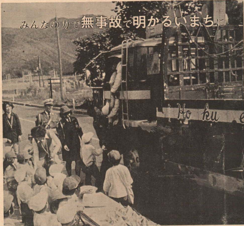
安全リボンと牛乳を配り「おじさん気をつけてね」と白沢幼稚園のよい子たちも交通安全運動に一役

これから寒くなるにつれ、事故の多発が予想されます。子供と老人の雨具や防寒衣は、できるだけ自由のきくものを着用させ、また、自転車の無灯火はやめ、交差点での正しい乗り方をしましょう。昨年は11月中だけで4人も尊い命が失われています。こうした悲しい記録はもうたくさんです。市民ひとりひとりがそれぞれの立場で交通規則を守り、無事故で、明かるいまちづくりに心がけましょう。