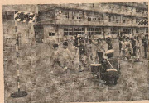
すばらしいプレゼントでたのしい交通教室

城南小学校では、このすばらしいプレゼントに大よこび、さっそく秋晴れの下、校庭で大館警察署員の指導のもとに交通教室を開校し、みんなで楽しく交通規則を学びました。