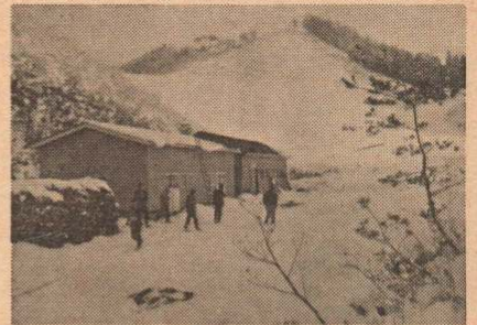
大館スキー場(手前の建物は増築されたヒュッテ)