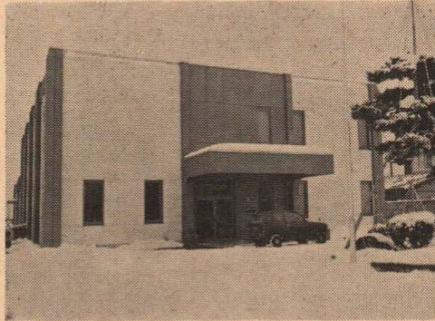
休日急患診療所が開設される健康センター