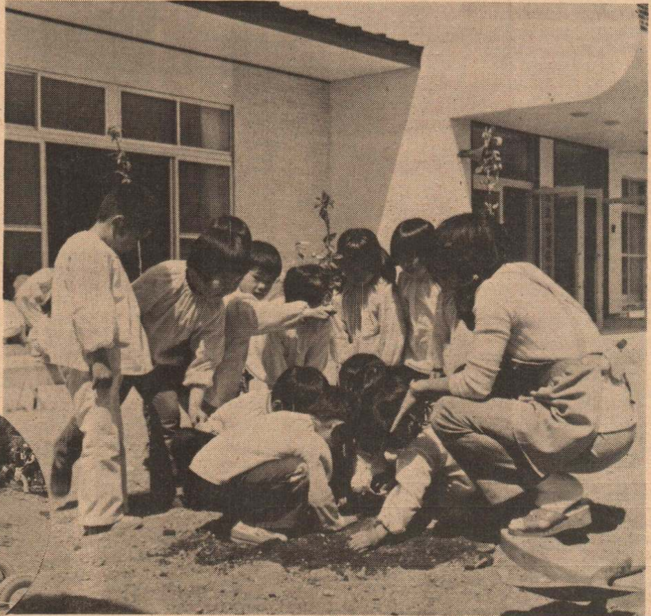
先生といっしょに、桜の苗木を植える有浦保育園のよい子たち