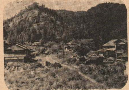
全戸の移転が決った合津前田集落