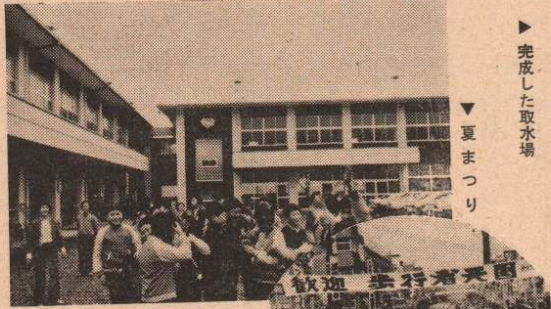
▲開校した南小学校

<12月> 1日・生活安全道路を城西地区に設置 5日・衆議院議員総選挙 17日・有浦小学校全焼 27日・「市民便利帳」を作成し全戸へ配付