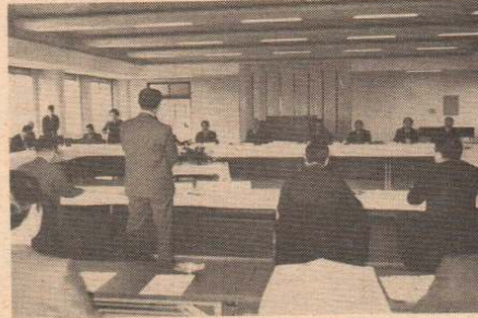
要望事項を説明する石川市長