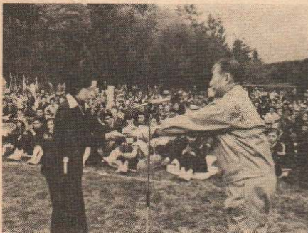
植樹祭標語入賞者の表彰

また、この植樹祭を記念して午後2時 からは桂城公園において、梅・桜の苗木 2,000本の緑のプレゼントも行われ ました。