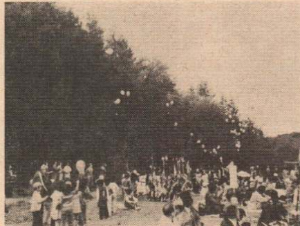
南小学校1年生による風船の放飛