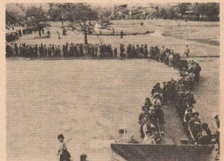
桂城公園で行われた「緑のプレゼント」