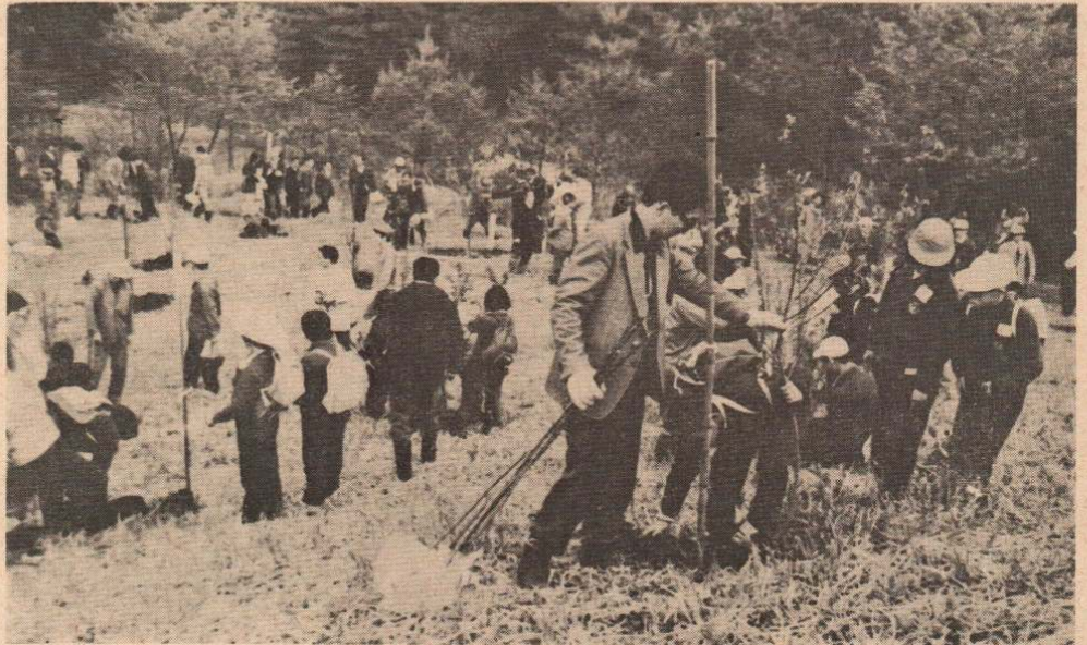
参加者全員でウメ苗木1,000本を記念植樹

「育てよう緑と花と郷土愛」をスロー ガンに第28回秋田県植樹祭が、5月20 日市民の森で行われました。