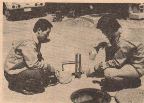
浄化槽の水質検査

以上、浄化槽の設置と管理について簡単にお伝えしましたが、詳しいことやいろいろなお相談は、市役所環境保護課(42-1212内線283)へどうぞ!