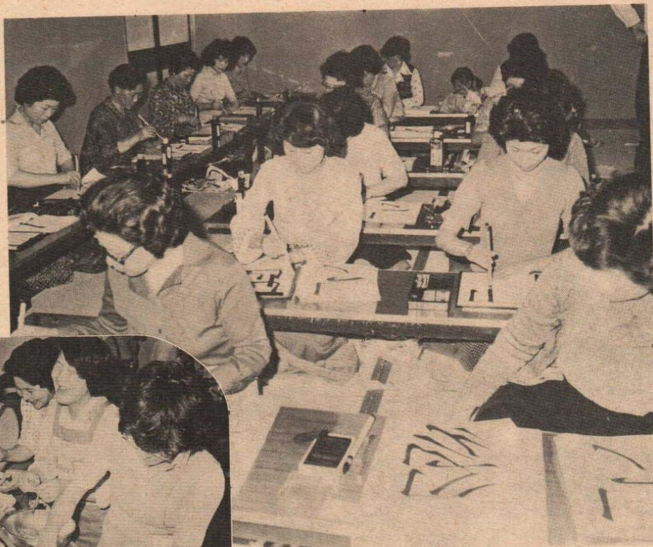
◆ 老いも若きも筆をとるまなざしは真剣そのもの……書道教室(上)

昼の部は、主として婦人の方達の料理書道、着付、洋裁、和裁、夜の部はヤングレディやサラリーマンを中心に、ペン習字と版画に、梅雨期の空模様もなんのその猛勉に励んでいます。