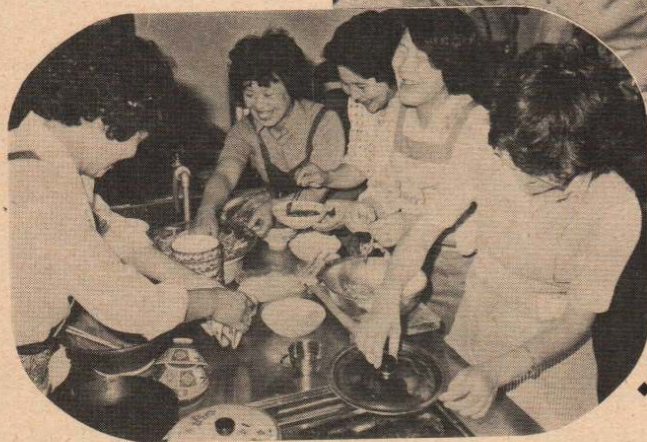
◆ より安く、よりおいしく栄養のバランスを考えて……料理教室(左)