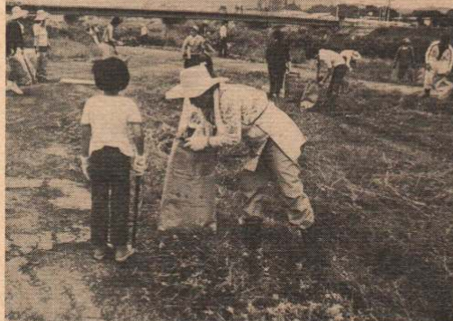
約3,000人が参加したクリーンアップ

長木川をきれいにしよう協議会では、これからはクリーンアップだけではなく川を汚さないよう呼びかけて行くこととしております。