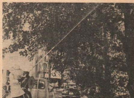
職業訓練校でのアメリシロ防除