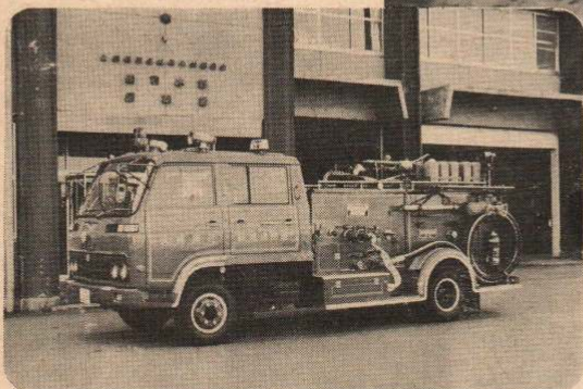
このほど日本損害保障協会から広域消防本部に寄贈された消防タンク車