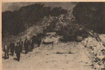
現在工事中の区域を踏査する同盟会の一行

同線は、3年後の55年に完成予定とされていますが、開通後は、黒鉱開発の産業道路として、又、十和田湖への観光道路としても利用され、表ルートの国道103号線に比べ距離、時間も短縮されるため、同線の早期完成が待たれています。