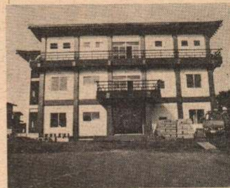
完成した秋田犬会館

また、来年5月3日の秋田犬本部展の開催にあわせて、前日の2日に完工式を行う予定とのことです。