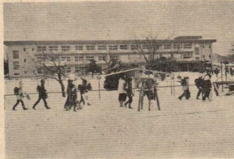
新築の有浦小と初登校の児童たち

一昨年12月17日の火災により校舎を焼失し、昨年3月から新築工事が進められていた有浦小学校は、秋の好天などにより工事が順調に進み、特別教室などを除いて普通教室はほとんど完成しました。これにより同校では、冬休みにプレハブ仮校舎からの引越しを完了、3学期から新校舎での授業を開始しています。