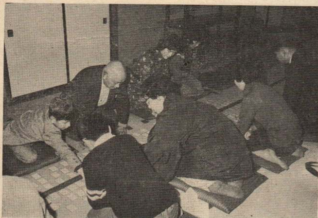
百人一首競技会 1月8日