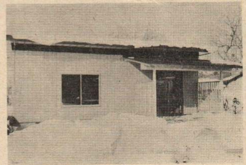
完成した赤石地区生活総合センター

今後は、同センターを衛生知識の習得と定期健康診断、それに料理講習会などの場として利用することにより、地区民の健康管理と食生活の向上、さらには農作業及び家事労働を合理化して婦人労働の軽減を図ることにより、明るく、豊かな住い地域づくりをしようとするものです。