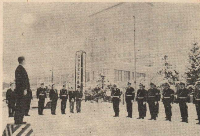
交通指導隊初出式 1月7日