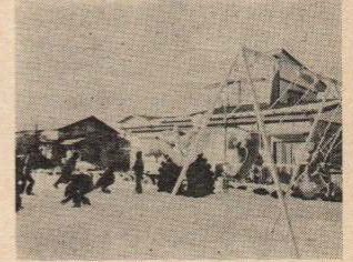
児童遊園地で元気に遊ぶ子供たち

下川口地区の方々の手による児童遊園地がこのたび開園しました。 道路添いに家屋が立ち並び、細長い集落を形成している同地区は、学校をはじめ公民館や保育園などの公共施設が上川口地区に集中しており、下川口地区にはこれといった子供の遊び場がありませんでした。子供たちは、わざわざ遠くまで遊びに行かなければならないことから路上で遊ぶことが多く、以前から交通事故などが心配されていたものです。 そこで、地区民の間で遊園地づくりの計画が進められていましたが、私有地370㎡を無償で開放してくれる方が現れ、昨年10月から地区民総出で盛土作業や整地を行い、又、市の社会福祉協会からのプランコの寄贈をはじめ、タイヤやす箱などの善意で施設も整備された暮に完成したものです。子供たちは父兄からのプレゼントに大喜び、車の不安もなく、毎日元気に遊んでいます。