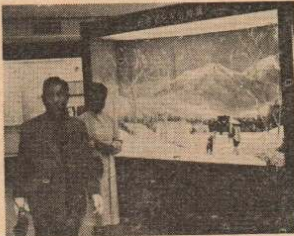
オープンした秋田犬資料館

同館は5月5日からオープンされ、入場料は大人が100円、子供が50円となっています。