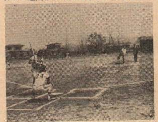
石川市長の始球式で記念試合

同球場の使用については、二井田公民館(電話45-2051)で、使用希望日の1週間前から受け付けています。