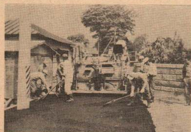
道路舗装など着々とすすめられている公共事業

うち、5月末までにすでに市道23路線の舗装改良工事や成章中新築工事及び下川沿公民館新築工事などの計64件、総額約1億5455万円の工事を発注、その執行率は47%になっており、第1・四半期の今月末までは、目標に近い63%まで発注する方針になっています。