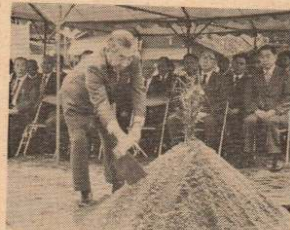
起工式でクワ入れする石川市長