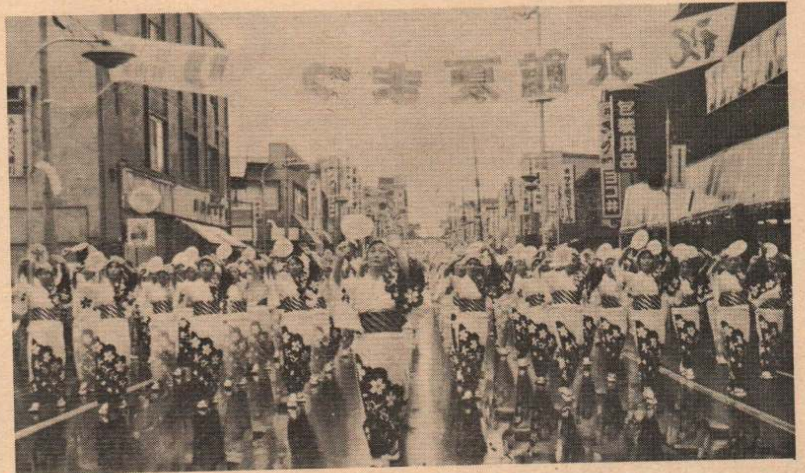
<夏まつり> あいにくの雨の中「1万人 おどり」と「歩行者天国」は16日に行われまし たが「大文字」は20日実施されました