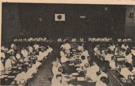
7月31日行われた行政協力員懇談会