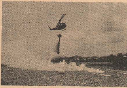
自衛隊ヘリによる林野火災の消火訓練