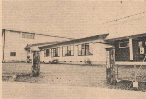
完成した下川沿公民館 下川沿保育所として使用されることになっています。

なお、完成による移転に伴い、下川沿出張所の業務も9月18日から、新公民館で行なっております。また、旧公民館は700万円増築模様替工事を、