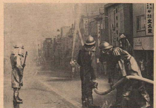
一斉放水による消火訓練