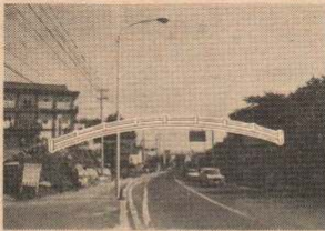
橋はこのような架けられます

桂城公園から国道7号線をまたぎ三の丸の秋田犬会館前に架かる太鼓橋の建設工事が7月31日から行われています。