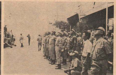
訓練を見守る統監・副統監の一行

昭和53年住民結核検診(レントゲン)を7月から各町内ごとに実施していますが、今回は次のとおり行いますので、忘れずに受診するようにしてください。