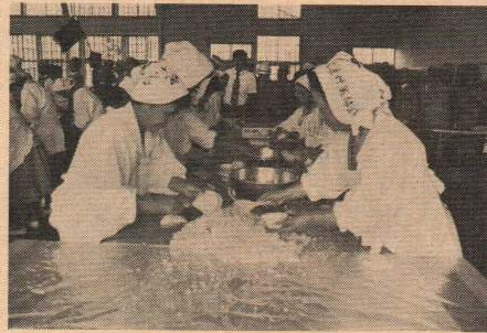
婦人会の方々による炊出し訓練