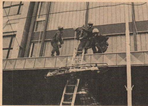
広域消防本部レンジャー部隊による救出訓練

全ての訓練が終了後、参加団体による市内パレード、そして市民体育館前での閉会式をもって、同訓練は事故ひとつなく、全日程を予定どおり終了してその幕を閉じました。