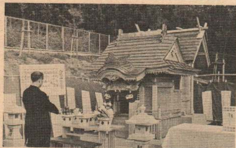
山館浄水場内に完成した水分神社鎮座祭