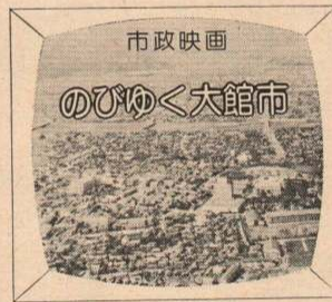
11月25日午後2時から秋田放送で放映