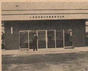
業務を開始した中央派出所

大館警察署中央警官派出所が、このほど旧大館警察署向い（三の丸）に完成し11月20日から業務を開始しています。この中央派出所は、警察署が市の中心部から離れた根下戸新町に移転したことにより、旧市内の方々の夜間などの不安を解消するために建設されたものです。