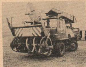
出番を待つ新鋭スノーロータリー車

とくに、市道の除雪対策としては、市の除雪グレーダーや、今年新しく購入したスノーロータリー車など6台のほか、市内の業者の除雪車84台、あわせて90台の機動力のもと、特にバス路線、1～2級道のうち基幹道路、その他日常生活上最も影響を及ぼすとみられる道路（生活道路）及び通学路の確保に力を入れるとともに、歩行者の安全のため歩道の