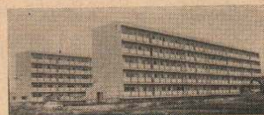
完成した雇用促進住宅