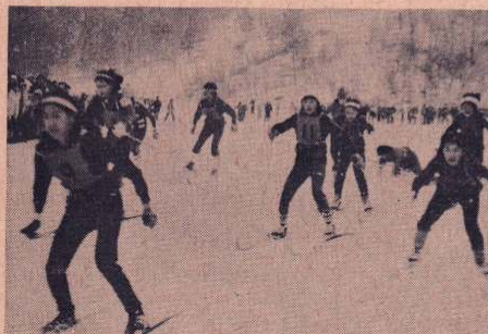
熱の入った距離競技