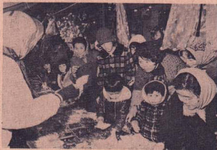
近年にない盛り上りをみせたアメッコ市

開催本部の発表では、2日間に12万の人出で、県外からの観光客も今年は例年以上であったとのこと、この伝統を誇る冬の風物詩「アメッコ市」が、観光都市としても飛躍しつつある本市の冬の観光行事として、市民みんなの力で、大きく育てて行きたいものです。