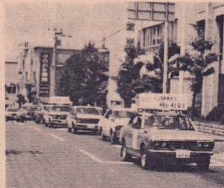
街頭パレードで市民への呼びかけ