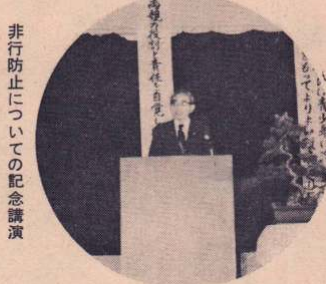
非行防止についての記念講演