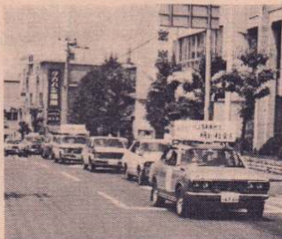
街頭パレードで市民への呼びかけ

は進学競争の落ちこぼれなど、さまざまな問題が考えられます。子供に対する無関心、放任、話し合いの欠如などが親子間の断絶を生み、子供の不平不満を高め、その結果、非行に走