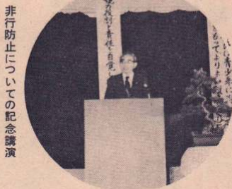
非行防止についての記念講演

は進学競争の落ちこぼれなど、さまざまな問題が考えられます。子供に対する無関心、放任、話し合いの欠如などが親子間の断絶を生み、子供の不平不満を高め、その結果、非行に走