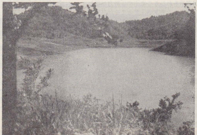
(写真の左後方がキャンプ場)

松峰部落から北西へ2軒、青葉の繁る山道を左に曲がると不動池に出る。この池は貯水池として造られたものですが、ここからは花矢町と大館市を一望できる個所もあり、また、木立が豊かで夏の避暑地としても最適であることから、よくキャンプが設営されています。今は渇水期で水位も6米程さがっており水泳はできませんが、附近に松峰神社もあり、行楽地としておすすめします。 (自動車で行けます)