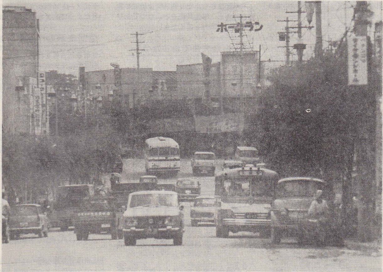
【写真】大町から南町方面の柳とトゲアカシヤ

「まちに緑を」と、昭和35年から植えた柳、青桐 トゲアカシヤ、銀杏、プラタナスなどの街路樹はいま、大館市の発展を象徴するかのごとく、すくすくと伸びています。大館市を緑のまちにするためにも、街路樹を大切にしましょう。